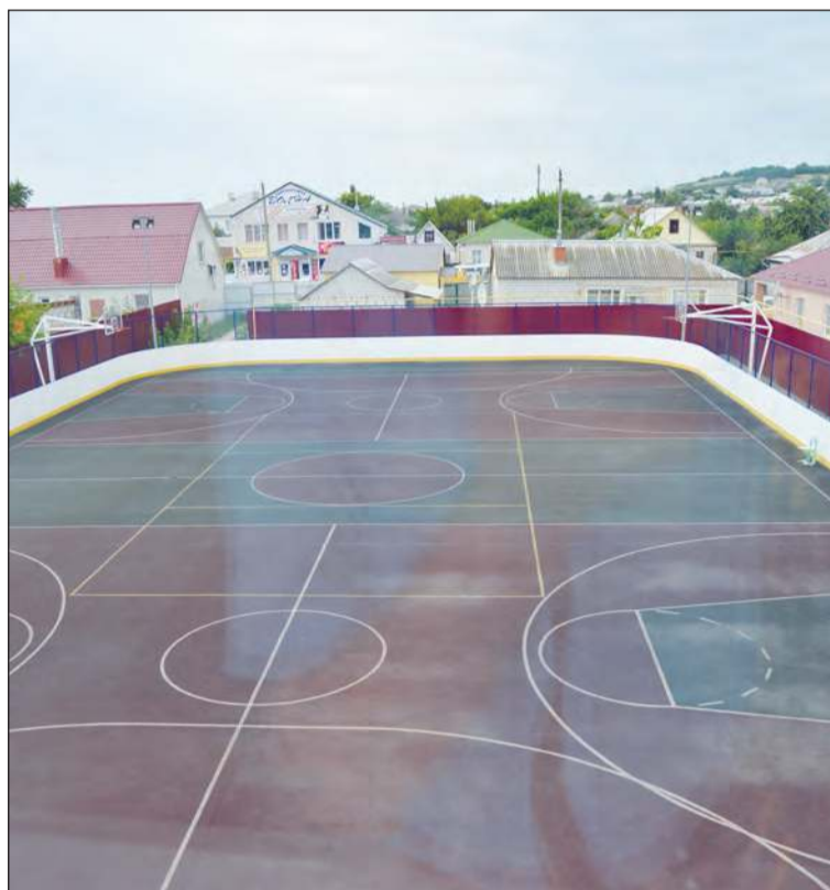
■ На такой площадке можно заниматься в любую погоду