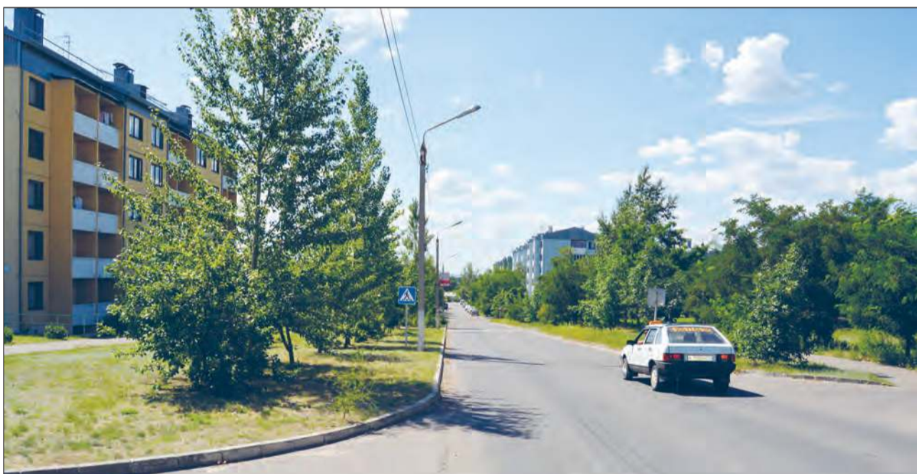
■ Жить в таком микрорайоне одно удовольствие.

Частными застройщиками введено в строй 10365 кв. метров жилья: 2009 г. – 2088, 2010 г. – 589, 2011 г. – 417; 2012 г. – 2960, 2013 г. – 4311.