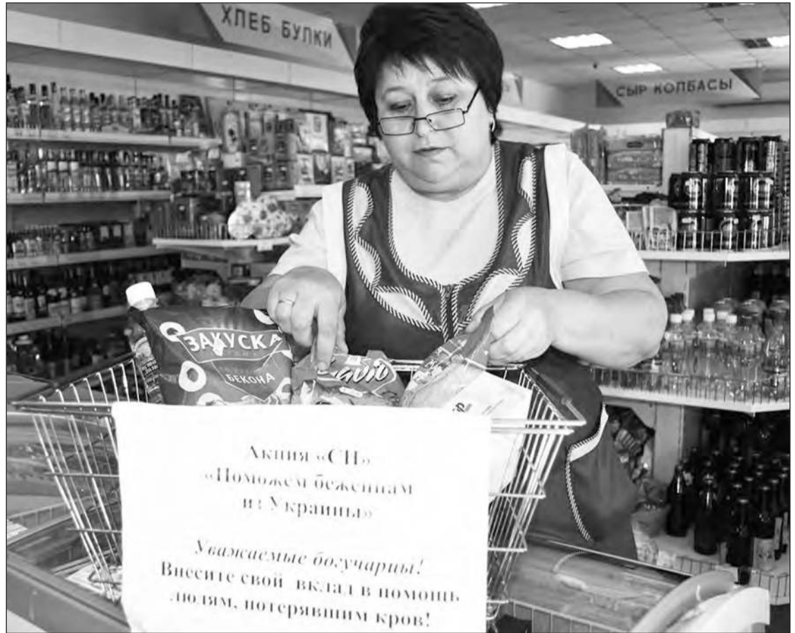
■ Хотелось бы, чтобы эта корзина не оставалась пустой

Помочь им в эти трудные дни – наш общий гражданский да и человеческий долг. Это то малое, что мы можем сделать сейчас для тех, кто оказался в очень сложной жизненной ситуации.