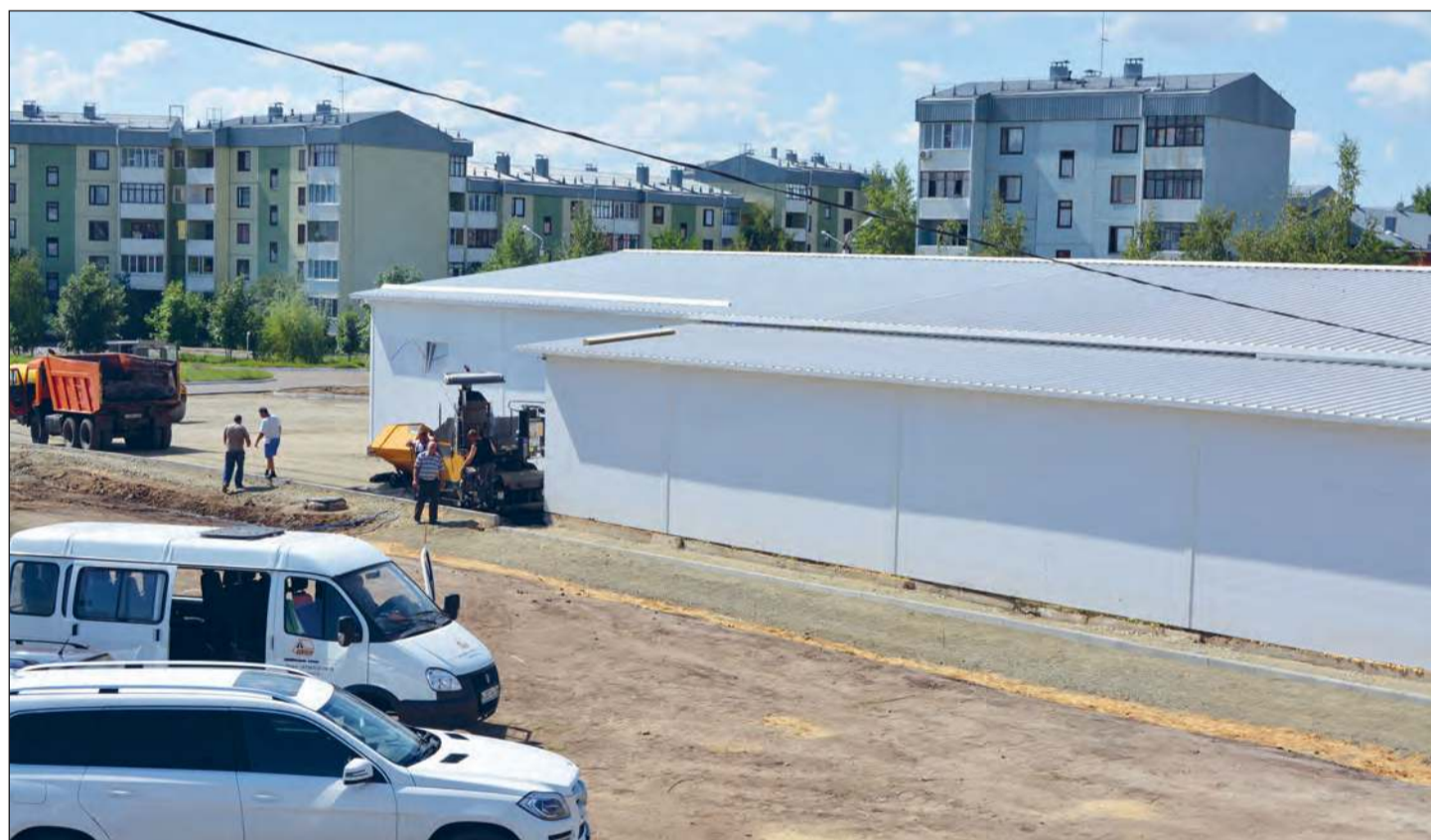
■ На строительной площадке – полный порядок

В нашем районе активно идет развитие современной инфраструктуры в сфере потребительских услуг