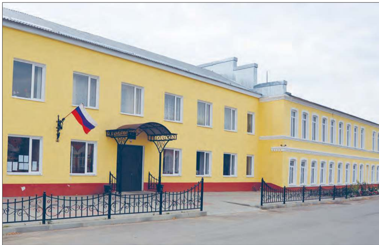
■ Богучарская средняя школа №1 сегодня как конфетка.

Чем запомнился этот период жителям района, что сделало их жизнь более комфортной: