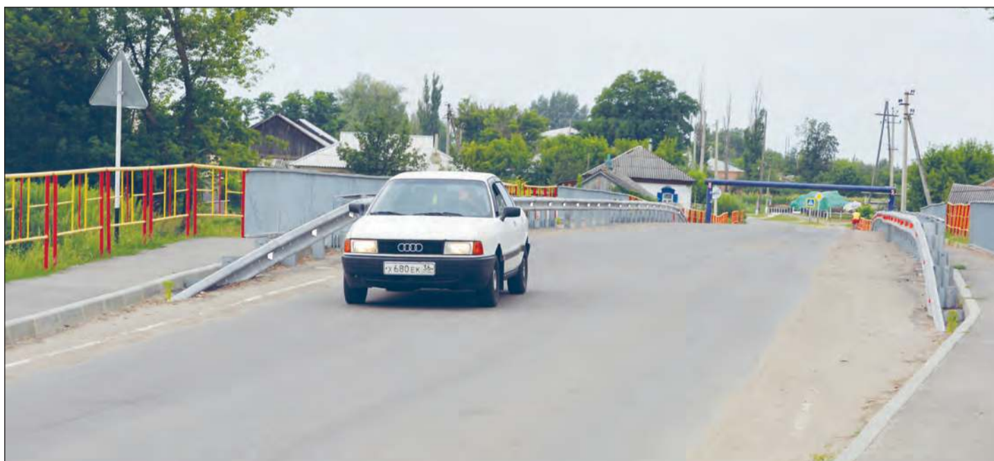
■ Путепровод связал две части Дьяченково в единое целое.

Возводится ФОК (физкультурно-оздоровительный комплекс) на стадионе «Юность». Пуск в эксплуатацию – 1 сентября 2014 года.