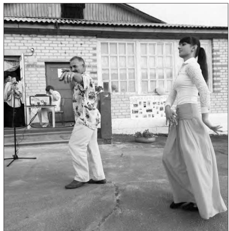
■ Национальный праздник – изюминка местного праздника