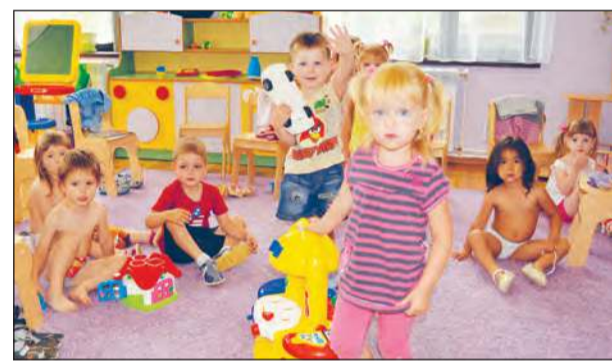
■ Малышам в новом садике нравится.

Благодаря этому очереди в детские сады в Богучаре в настоящее время нет.