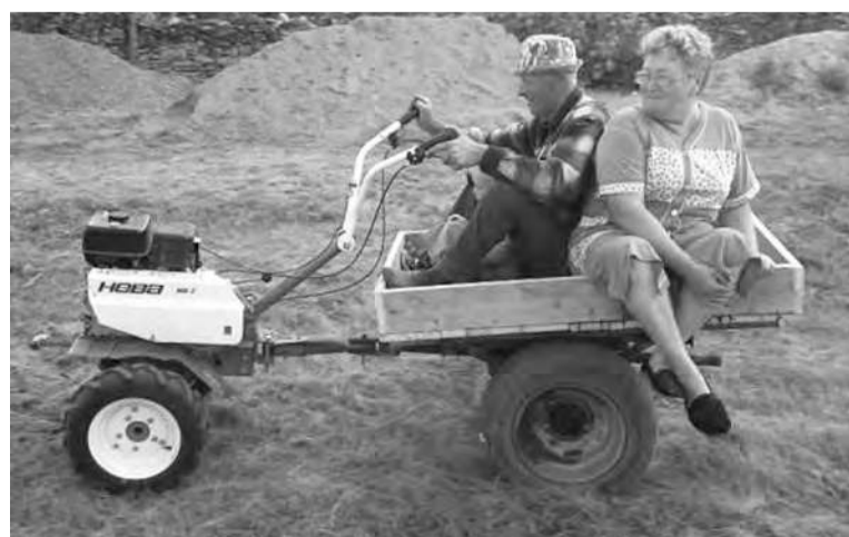
■ Богучарцы умеют хорошо поработать и с душой отдохнуть