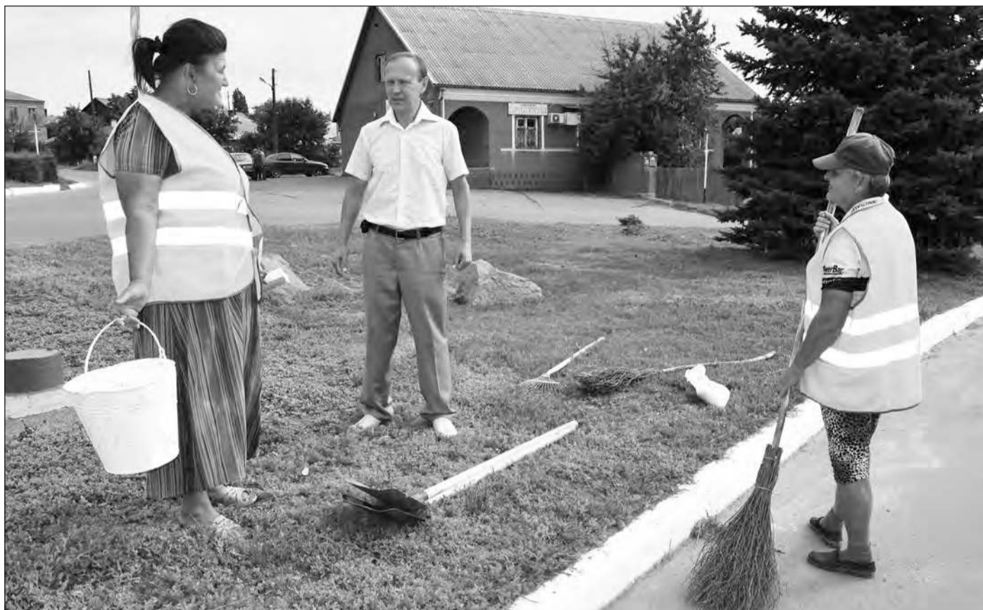
■ Вопросы благоустройства глава города держит на личном контроле

Мобильный диабет-центр будет работать на территории районной больницы 5 августа с 9.00 до 15.00.