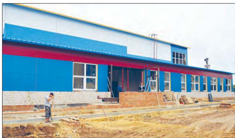
■ Строительство ФОКа на стадионе «Юность» близко к завершению

В районе – 151 спортивный объект: один стадион, 26 спортивных залов, 112 спортплощадок, два бассейна, три стрелковых тира, пять тренажерных залов, два борцовских зала, шахматный клуб.